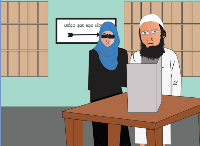
ජන්දය ප්‍රකාශ කිරීමේදී සහයකයෙක් අවශ්‍ය වේ.