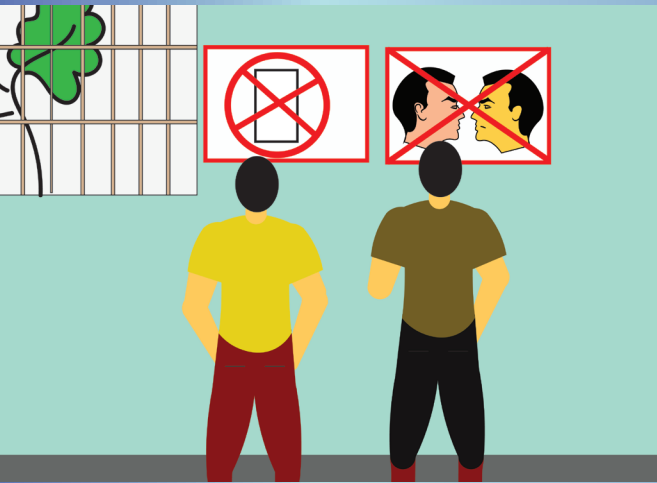
රූප මාධ්‍ය තොරතුරු අවශ්‍ය වේ.

ආබාධ සහිත පුද්ගල සංවිධාන ඒකාබද්ධ පෙරමුණ. නො 33, රජ මාවත, රත්මලන. දු.අ / ල.අ - 011-2721383 විද්‍යුත්තැල් - dojfi@sltnet.lk / dojfsi@gmail.com